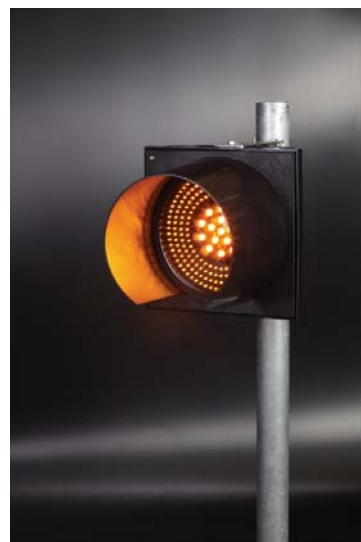
• 고정용 브라켓트 지주 • Bracket Pole